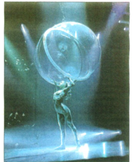
Espectacular show de contorsionismo.

presa durante la cena con performances y shows que mantienen en vilo al comensal. Después de la cena el espacio se transforma en el lugar idóneo para disfrutar de la