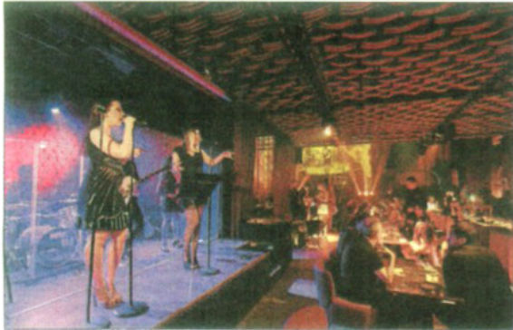
Sofisticada música en vivo durante la cena.

Heart Ibiza presenta una nueva propuesta de gastronomía, arte, ocio y música avalada por los hermanos Adrià y espectaculares 'shows' del Cirque du Soleil que mantienen al comensal expectante en todo momento