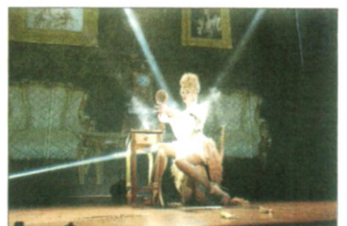
La divertida maestra de ceremonias.