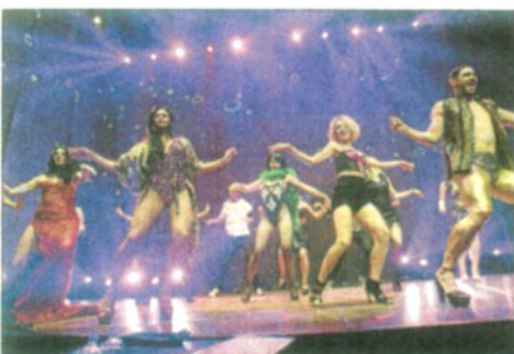
Brillante puesta en escena del grupo de baile.

y Submission, que marcarán una nueva manera de vivir la apasionante noche de Eivissa en un lugar donde el espectáculo está servido desde el primer bocado.