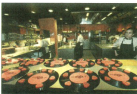
Postre del menú con sello de Albert Adrià.