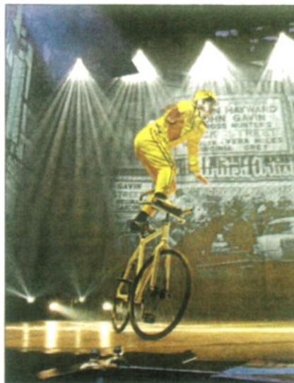
Performance de ciclismo y humor.

Heart Ibiza propone ahora un viaje gastronómico y audiovisual de última tecnología que transporta al cliente a un mundo de fantasía, diversión y constante sor-